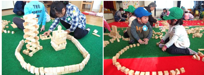
このようにたくさんの作品が完成していました!