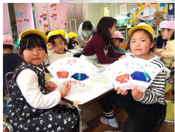
ひな人形づくり! 作る過程が色々となりましたが、集中して取り組んでいました。かわいいひな人形、ぜひお家に飾ってね♡