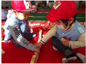
さかえKidsのお友達も楽しんでいました☆

月1回行われているつみ木コーナー! 様々な作品が作られていて、スペースの関係ですべてご紹介できないのが残念です…!