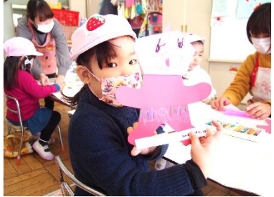
ジャン! 個性豊かな鬼を完成させていました(#^^#)