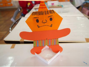
牛乳パックを利用した土台に鬼のをせることができます。