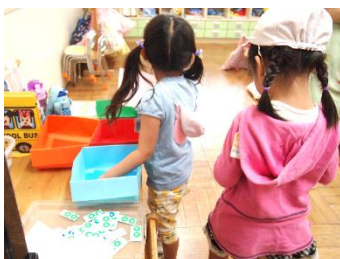
箱の中をのぞくと折り紙が！ 何色のを作ろうかな？