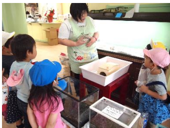
えっ！！はりねずみさん！ どうやって測るの？