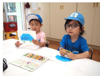
タイヤのシールをつけて完成!! 「ぶつぶー!!」と言いながら 遊ぶカワイイ姿が♡