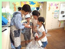
お天気のマークを選 んで色を塗ったり