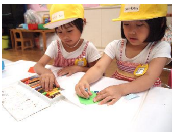
作った折り紙に絵を描いて 仕上げをします～!!