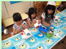
お絵描きをします！