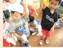
お魚さんができたら、 さかなつりスタートです!!