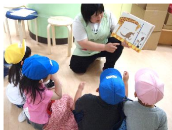
はじめに、絵本「どうぶつ しんちょうそくてい」を読 んで期待が高まります♡

今回は動物の身体測定でした！！「どうやってはかるの？」とのぞきこむ子どもたちでした！