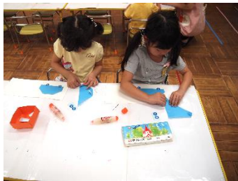
アイロンをしっかりとけ ながら折っていきます。