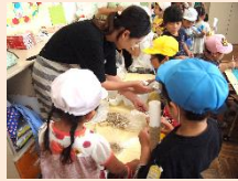
お母さん先生に材料 をもらいます！