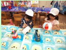
セロテープでとめ たら完成!!